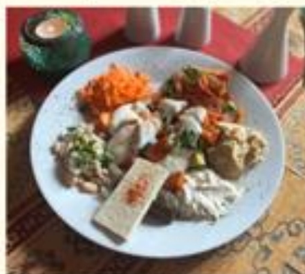
09 Karışık Meze