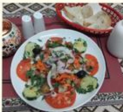
06 Coban Salatasi