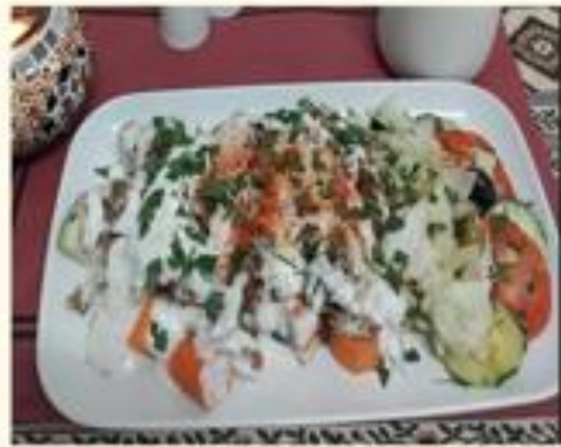
19 Sebze üzeri Et Döner

20 Sebze üzeri Mix Döner Kebab de ternera y pollo sobre verduras cocidas con yogur de ajo 11,00 €