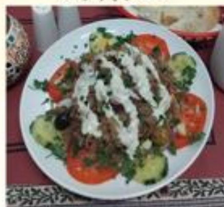
08 Et Döner Salatası