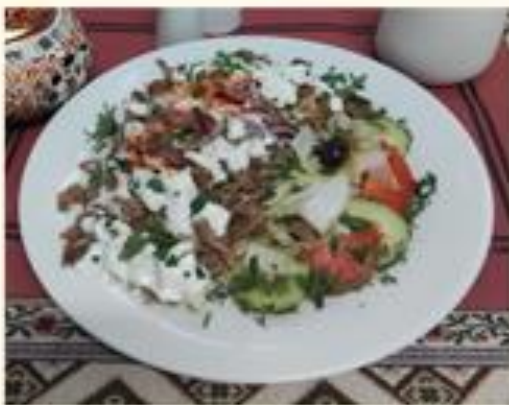
22 Et Döner Tabağı

23 Mix Döner Tabağı Kebab de ternera y pollo en plato con ensalada y papas fritas 11,00 €