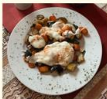
05 Karışık Kızartma